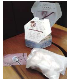
開けるワクワクを楽しんで下さい！

ラポ商品「シマエナガさんのこな雪ポルポローネ」が新登場です！米粉のクッキーに雪に見立てた真っ白な砂糖糖をまぶしたスペイン生まれのお菓子で雪の妖精とも呼ばれる人気の野鳥、シマエナガをイメージして作りしました。1個が8グラムと大人のシマエナガと同じ重さで作られており、口に入れるとまるで粉雪のように軽くてホロホロととろける食感が楽しめます。雪の結晶をイメージした六角形のパッケージには各面がかわいいシマエナガのイラストがあらわれ、どこから見ても素敵です。中にはシマエナガのフォトカード（全2種類のどちらか）も入っています。1箱8個入りで600円（税込）。お菓子もとっても美味しいので、これからのクリスマスプレゼントや年末年始のちょっとしたおみやげにオススメですよ。（近藤）