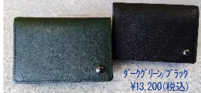
ダークグリーン/ブラック ¥13,200(税込)

す。開口部は巾着仕様になっていて紐をしぼらない時はオープントートとして使用可能。シュリンクさせた表面はキズや汚れにも比較的強いので普段使いにも最適！次にその薄さが最大の魅力の「オクサー」名刺入れ。デザインから機能性を含め、職人が何度も試作を重ねて丁寧に作り上げられエレガントでスタイリッシュに仕上げられています。素材は傷の目立ちにくいエンボスレザー。金具はブラックニッケルで統一。是非一度手に取っていただきたい一品です！（遠藤）